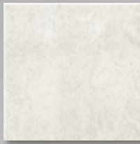
Beige, steinmatt, strukturiert