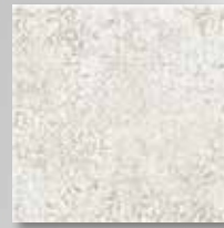
Fence Beige, steinmatt, strukturiert