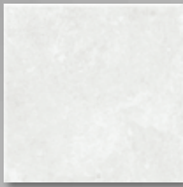
Weiss-Grau, steinmatt, strukturiert