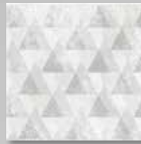
Geo Grau mehrfarbig, steinmatt, strukturiert